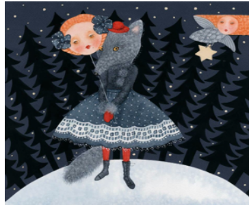
"Cappuccetto Rosso". Tecnica mista; 23,2 × 25,4 cm, Viive Noor