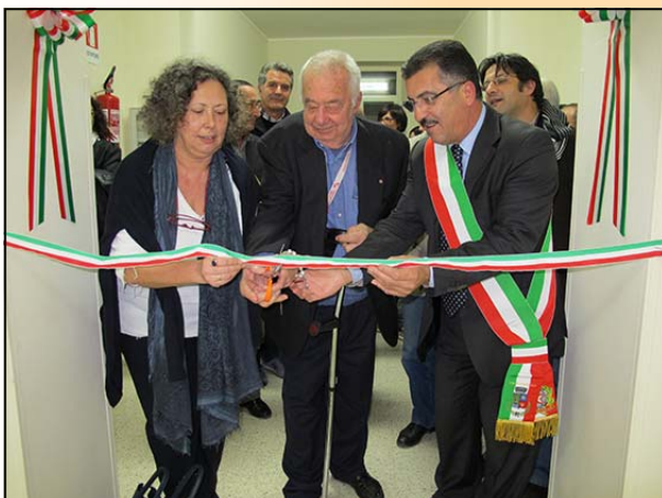
Il taglio del nastro

Si è tenuto lo scorso 17 Novembre presso il palazzo comunale di Botricello, il convegno di presentazione della mostra permanente “Botricello 1967 – 1972: Scavi Archeologici alla Marina di Bruni”. L'evento rientra nell'ambito del progetto di Cooperazione Transnazionale “Racconti dal Mediterraneo” che il G.A.L. Valle del Crocchio sta portando avanti con altri G.A.L. greci e ciprioti.