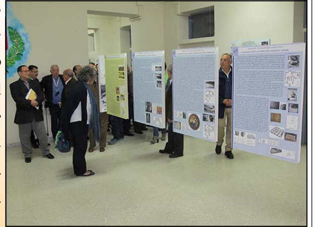
La mostra allestita all'interno del palazzo comunale