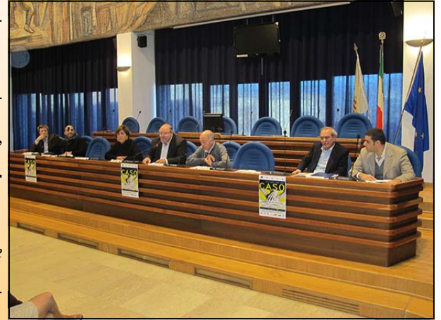
Il tavolo dei relatori