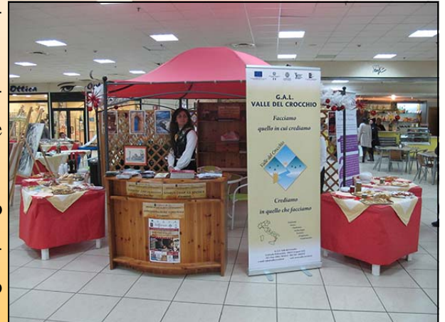
Lo stand del G.A.L. Valle del Crocchio

Sono stati coinvolti artigiani provenienti dal comprensorio del Reventino, della Valle del Crocchio e del Crotonese per diffondere e far incontrare realtà diverse, che però, insieme, sono capaci di rappresentare questa nostra immensa risorsa umana.