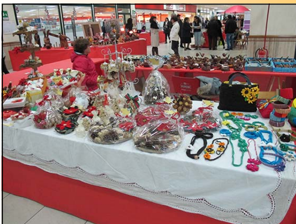
L'interno dello spazio espositivo

Attraverso l'esposizione dei diversi manufatti, rigorosamente