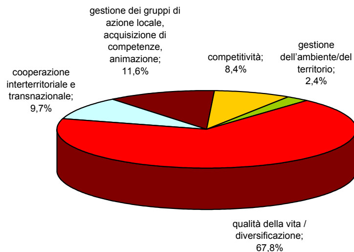
Spesa pubblica - Distribuzione percentuale delle misure ASSE 4