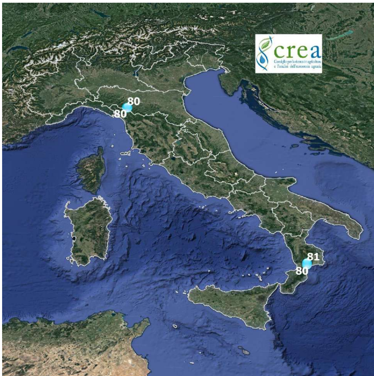
Fig. 3 – Punti di rilievo per Castanea sativa . Observation sites for Castanea sativa .

Di seguito, è presentata la carta con i valori della scala BBCH rilevati dai nostri rilevatori e che descrivono lo stadio di sviluppo raggiunto dal Castagno. I rilievi fenologici di questa settimana sono stati effettuati in 4 siti tra il 1 e il 3 ottobre.