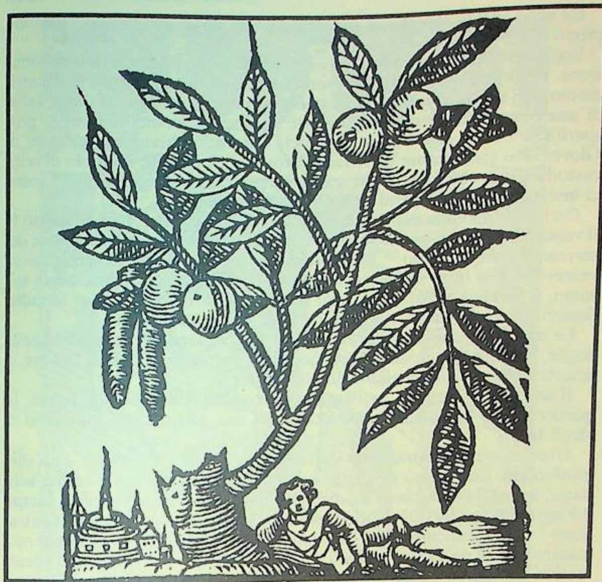
Albero di noce in un disegno tratto da Herbario Nuovo.