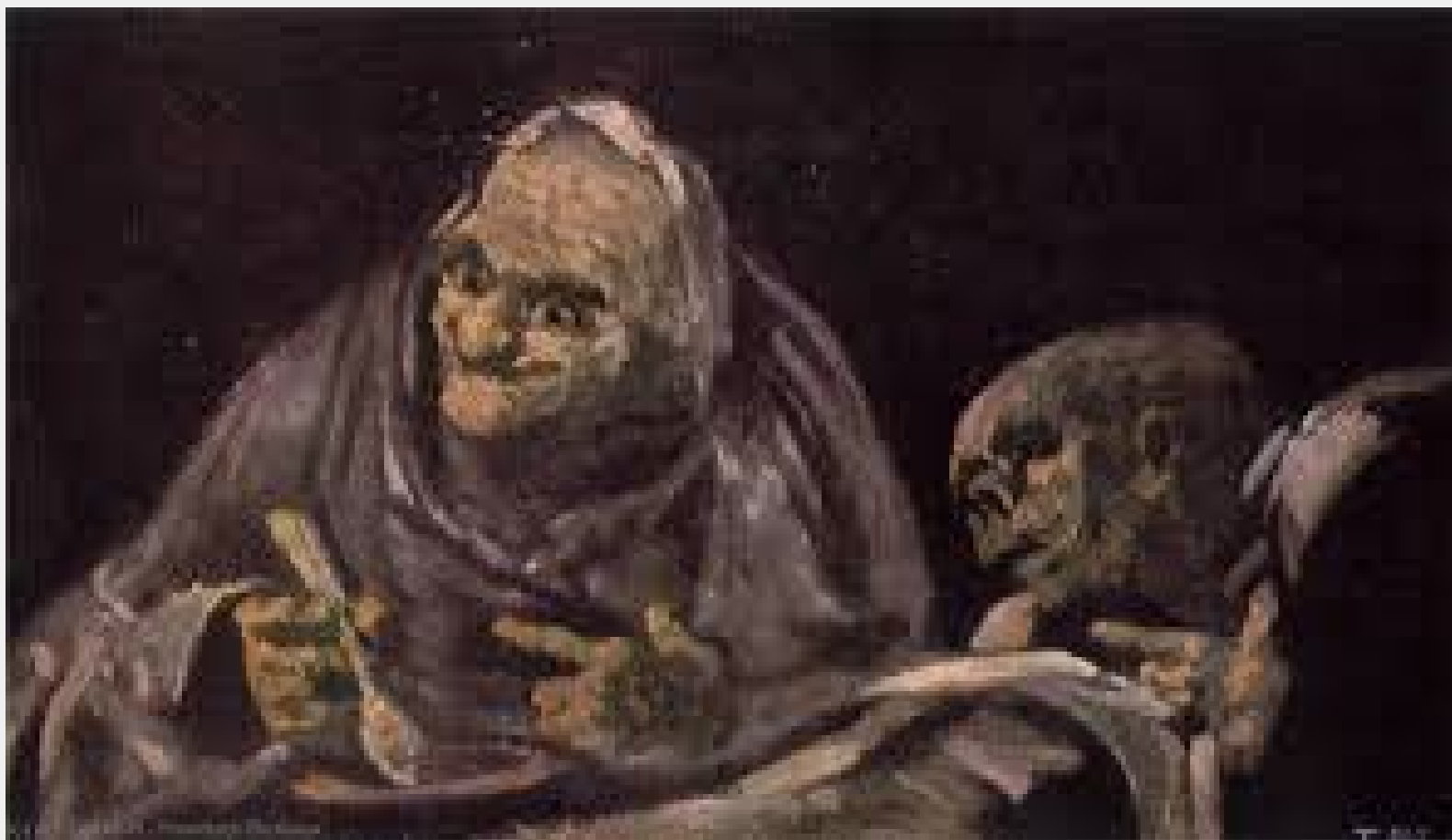
Francisco De Goya