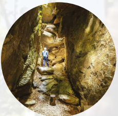
Illustrazione dei contenuti di schede tecniche e guida informativa

Architetto del Politecnico di Torino, consulente per CPD Consulta