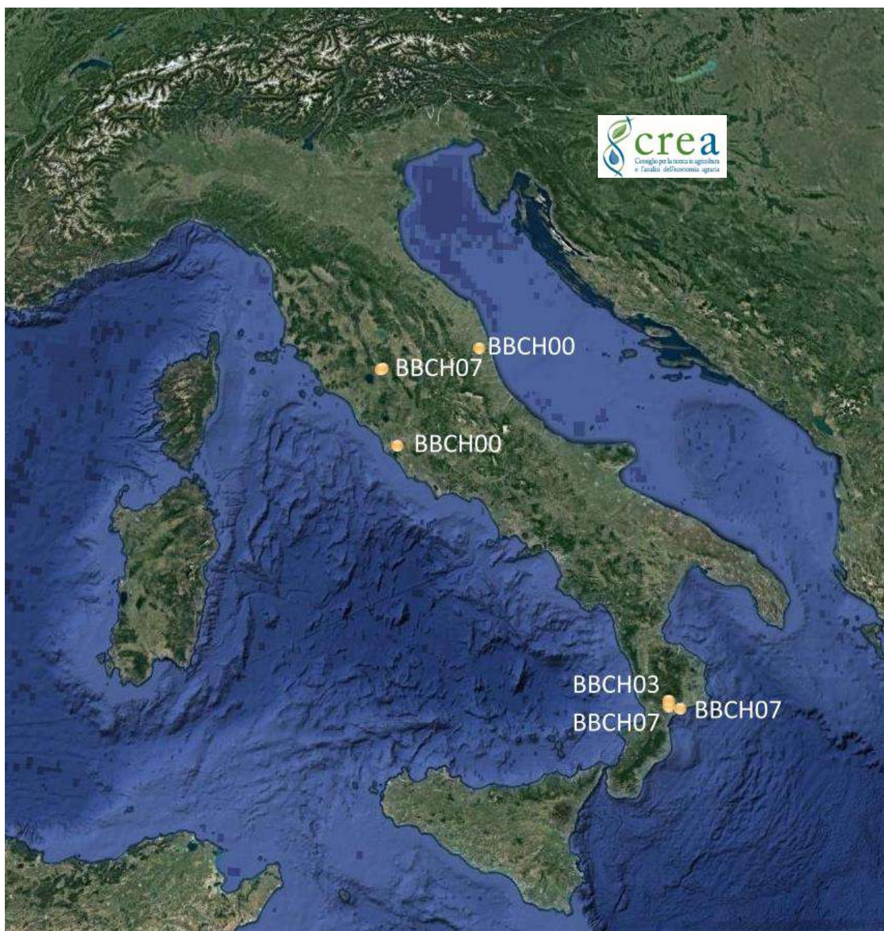
Fig. 1 – Punti di rilievo per Robinia pseudoacacia . Observation sites for Robinia pseudoacacia .

Di seguito, è presentata la carta con i valori della scala BBCH rilevati dai nostri rilevatori e che descrivono lo stadio di sviluppo raggiunto dalla Robinia in quei punti stazione. I rilievi fenologici di questa settimana sono stati effettuati in 7 siti tra il 3 e il 5 marzo. La carta di analisi potrà essere pubblicata quando il ciclo di sviluppo sarà prossimo alla fase di fioritura.