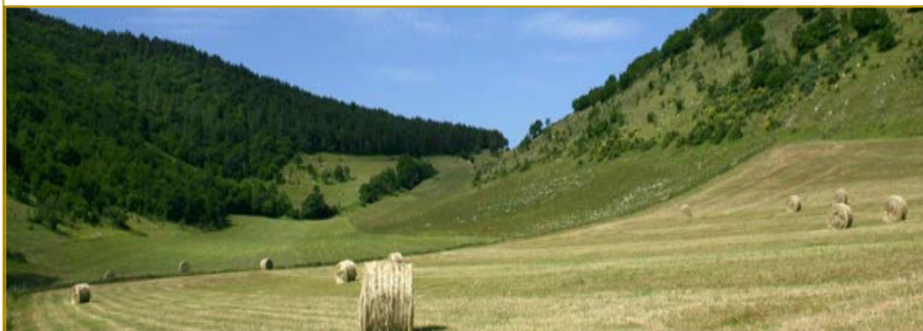
Prateria in alto piano