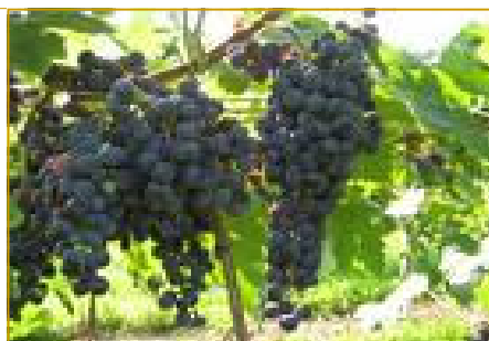
Economia agricola vigneto