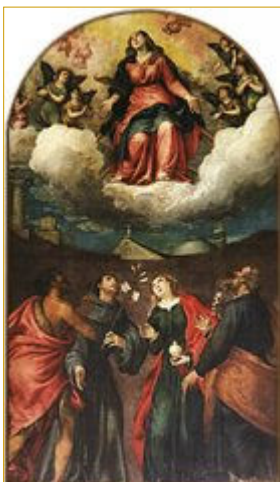
Maria Assunta di Lorenzo Lotto