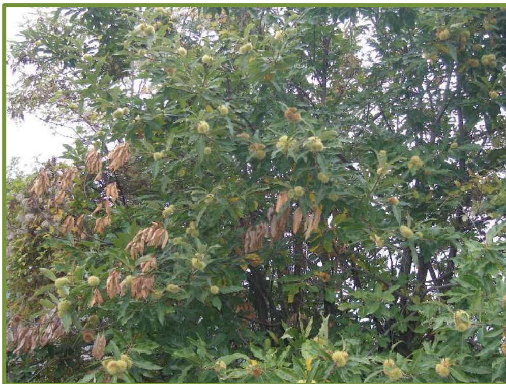
Fig. 5 TN03