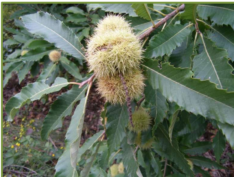
Fig. 6 – Foto di Franca Valentini TN03