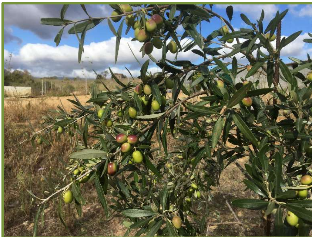
Fig. 3 SS01