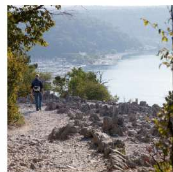
I sentieri più belli in Carso ed Istria

Importanza dei rapporti pubblico/privato e riuscire a utilizzarne i risvolti positivi.