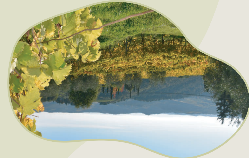
Vigneti di Lamole - prov. di Firenze

L'Italia offre un patrimonio incomparabile di paesaggi rappresentativi delle tante civiltà che hanno rimodellato il territorio agricolo. Essi costituiscono un'eccezionale ricchezza, sono espressione dell'identità culturale e dell'immagine del nostro Paese nel mondo e rappresentano un obiettivo primario di tutela e conservazione. Le mappe dei paesaggi rurali sono una guida snella e di facile accesso, per scoprire la bellezza e le sensazioni.