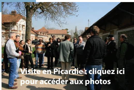
Visite en Picardie : cliquez ici pour accéder aux photos

Fiche ressource téléchargeable sur le site du Réseau.