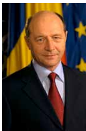
Traian BĂSESCU Președintele României

De asemenea, implementarea acestui Program în România prin Agenția de Plăți pentru Dezvoltare Rurală și Pescuit, în baza unor proceduri de lucru stricte, clare și transparente, a permis asigurarea și derularea corectă a procesului de acordare și decontare a plăților. ■