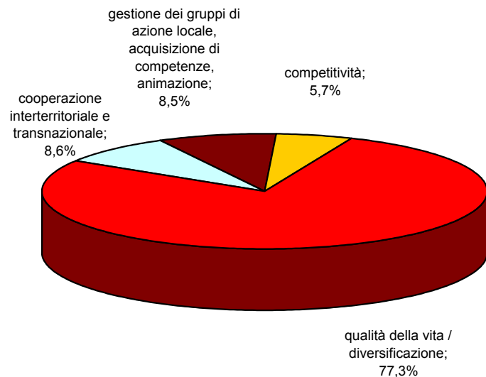
Spesa pubblica - Distribuzione percentuale delle misure ASSE 4