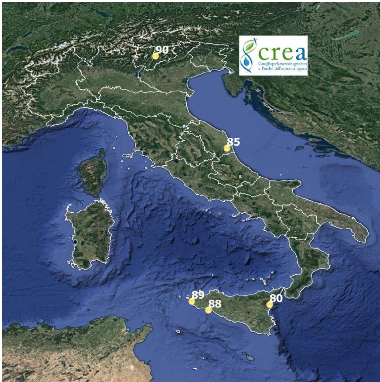
Fig. 3 – Punti di rilievo per Vitis vinifera cv Chardonnay. Observation sites for Vitis vinifera cv Chardonnay.

Di seguito, è presentata la carta con i valori della scala BBCH rilevati dai nostri rilevatori e che descrivono lo stadio di sviluppo raggiunto dalla vite cv Chardonnay nei punti stazione monitorati. I rilievi fenologici di questa settimana sono stati effettuati in 5 siti tra il 10 e il 13 agosto.