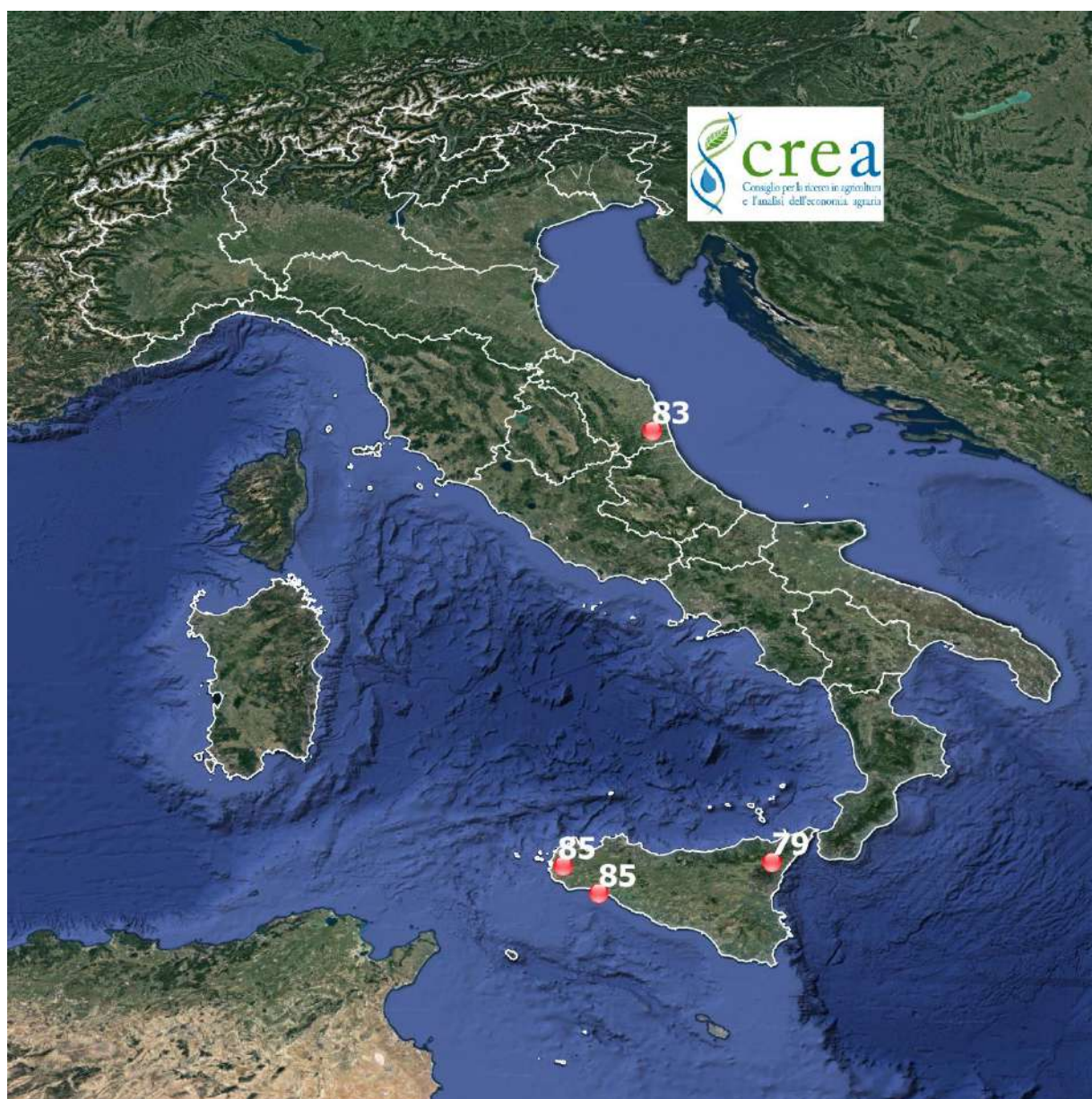
Fig. 2 – Punti di rilievo per Vitis vinifera cv Cabernet Sauvignon. Observation sites for Vitis vinifera cv Cabernet Sauvignon.

Di seguito, è presentata la carta con i valori della scala BBCH rilevati dai nostri rilevatori e che descrivono lo stadio di sviluppo raggiunto dalla vite cv Cabernet sauvignon nei punti stazione monitorati. I rilievi fenologici di questa settimana sono stati effettuati in 4 siti tra il 12 e il 13 agosto.