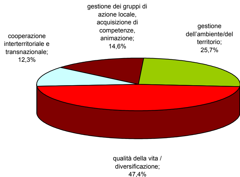
Spesa pubblica - Distribuzione percentuale delle misure ASSE 4