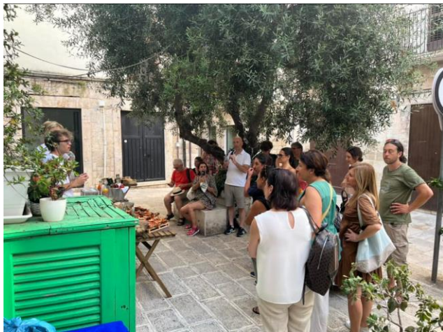
Fig. 3 – Presentazione della start up Ciclomurgia nel centro storico di Molfetta Fig. 4 – E-Bike tour ad Alberobello