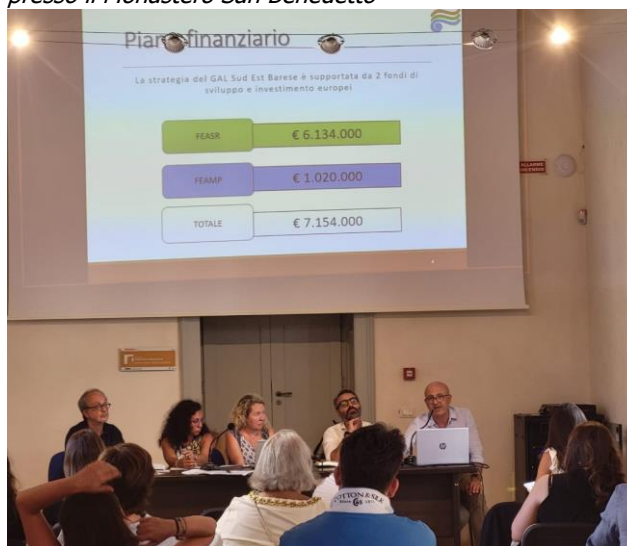
Fig. 1 – Convegno di presentazione della study visit presso il Monastero San Benedetto