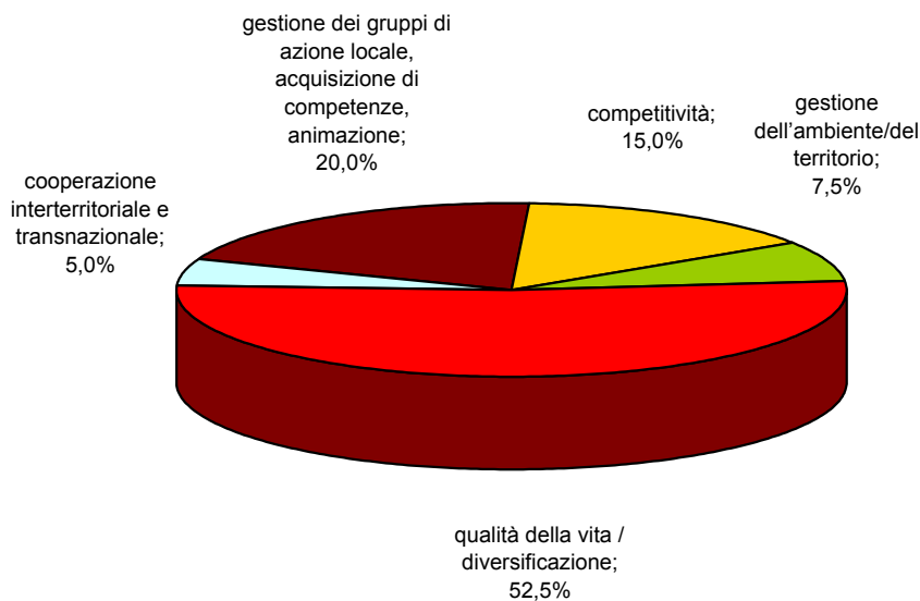
Spesa pubblica - Distribuzione percentuale delle misure ASSE 4