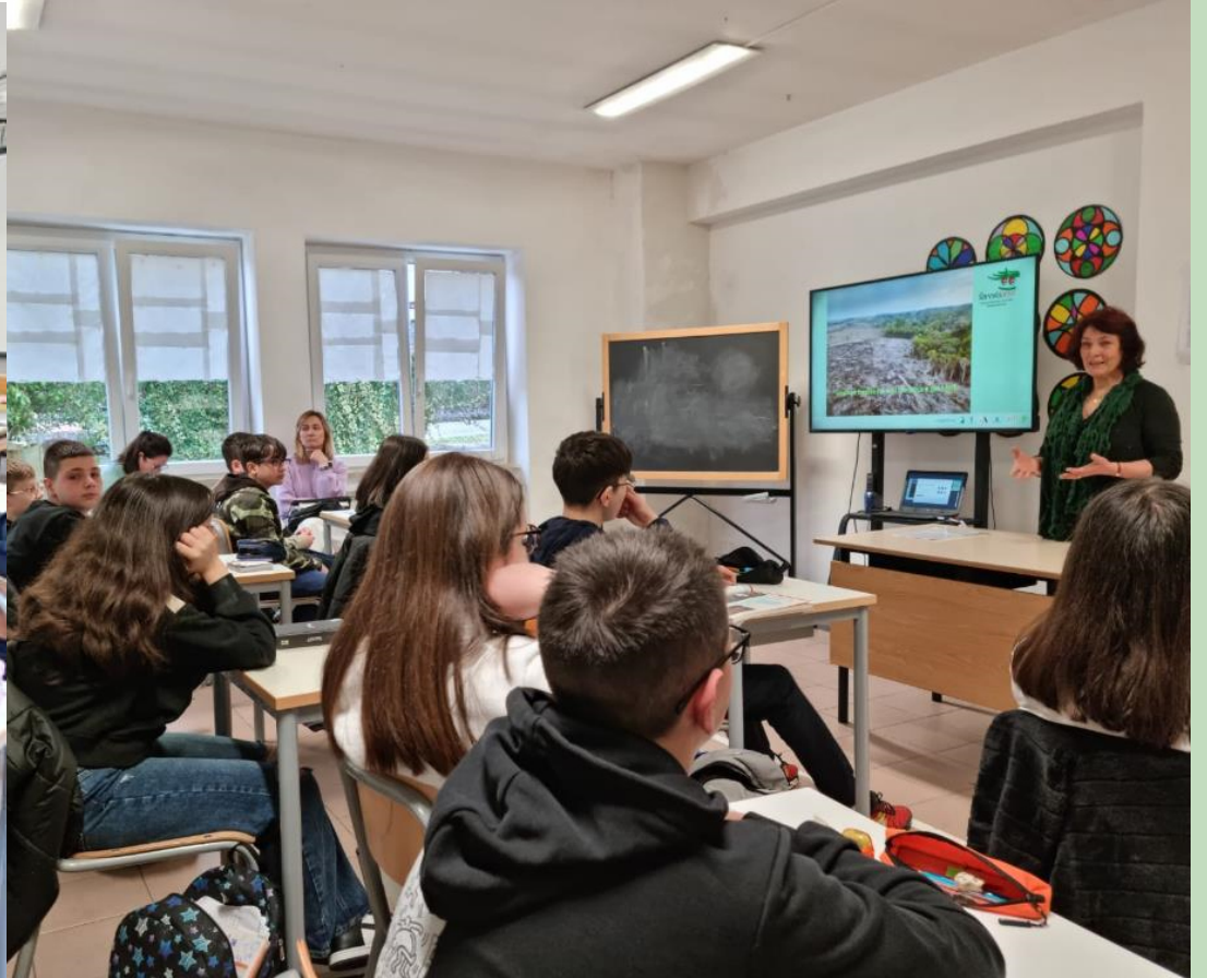
Momenti di attività formative svolte in classe