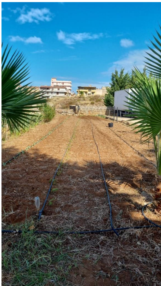
Figura 2 - Orto condiviso presso l'azienda agricola Cecala