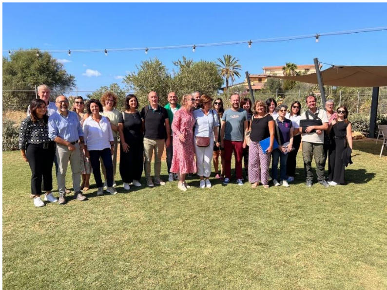
Figura 1 - Foto di gruppo dei partecipanti