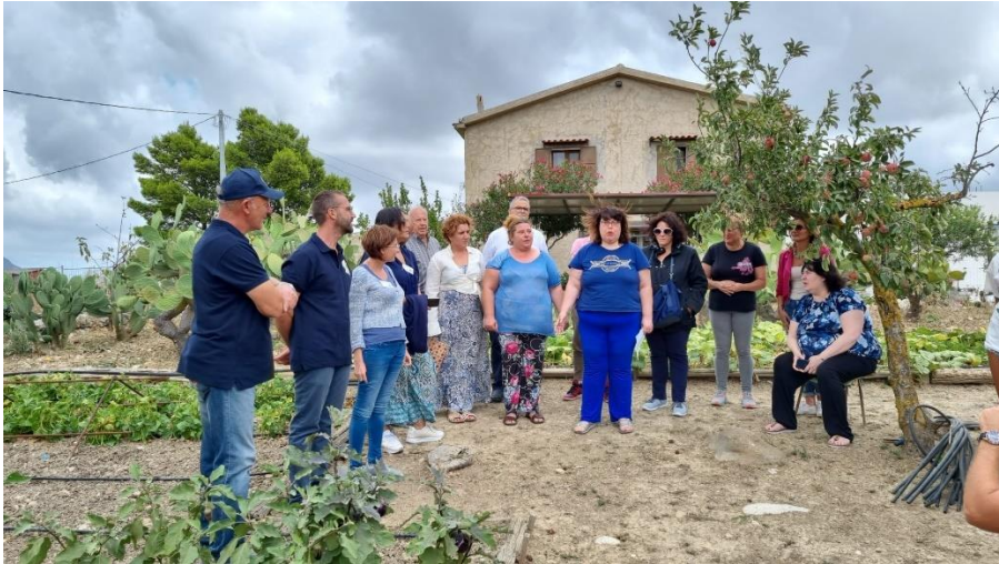
Figura 5 - Visita alla Fattoria Alesi

Nel pomeriggio, presso Case Mistretta ad Altavilla Milicia (PA), attraverso azioni dimostrative dei laboratori attivati (orto condiviso, raccolta delle olive, attività sportive, attività ludico-ricreative) è stato presentato il progetto Terra Mia, finalizzato alla realizzazione di orti condivisi, laboratori di educazione alimentare, attività sportive, attività di valorizzazione di spazi naturali, attività ludico-ricreative.