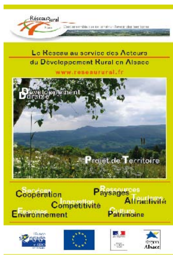
Affiche conçue pour faire connaître le réseau alsacien lors de manifestations régionales

L'après-midi, les participants se sont réunis autour d'experts régionaux et nationaux sur le thème « La place des territoires ruraux dans la stratégie de l'Union Européenne à l'horizon 2020 ».