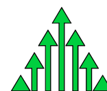
Comunità Montana dell'Appennino Forlivese

COMUNITA' MONTANA ACQUACHETA ROMAGNA TOSCANA