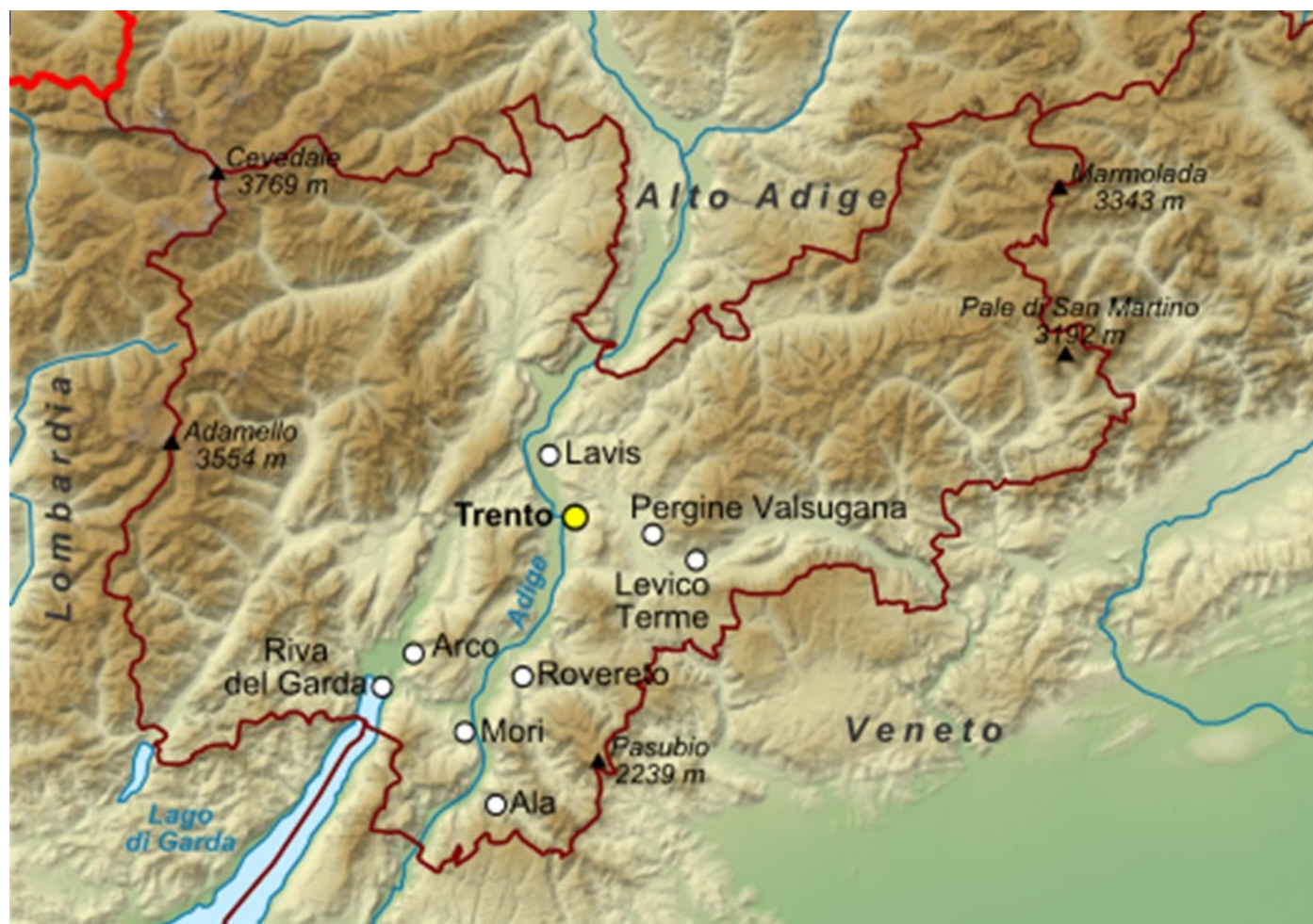
Tabella 8.2.9.I Misura 13 - Cartina del Trentino

Di seguito si riporta cartina geografica del Trentino.