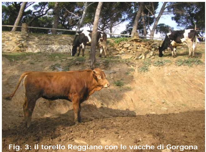
Fig. 3: il torello Reggiano con le vacche di Gorgona

L'altro scambio riguarda un rapporto di amicizia e collaborazione con il Comune di Neviano degli Arduini (PR). Questo territorio appenninico, vocato alla produzione di latte per il parmigiano reggiano, registra da anni l'introduzione dell'omeopatia unicista in molte sue stalle. Un incontro quasi impossibile se non fosse stato per gli animali (e in particolare le vacche) e la