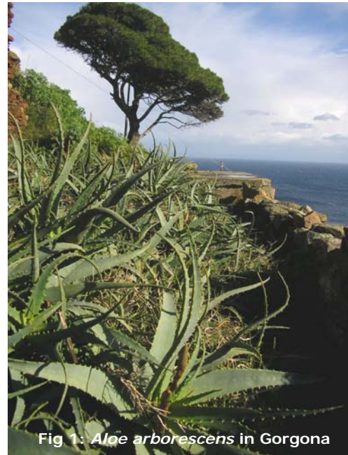
Fig 1: Aloe arborescens in Gorgona

Per quanto detto, quindi, una struttura di questo tipo non è assimilabile a un qualsiasi altro allevamento e le dinamiche interne all'attività penitenziaria e le finalità dell'isola si intrecciano e spesso condizionano pesantemente le esigenze degli animali e della loro gestione.