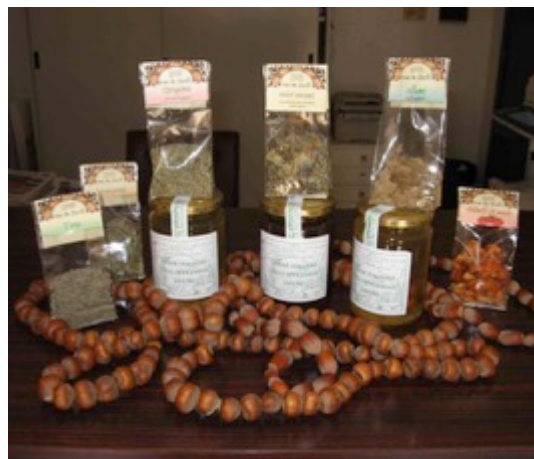
Foto 11 Collane di nocciole e prodotti delle valli