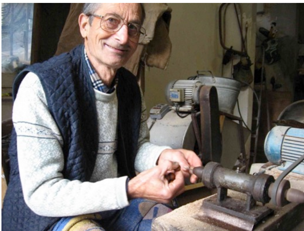
Foto 9 Bucatura delle nocciole del la formazione delle collane