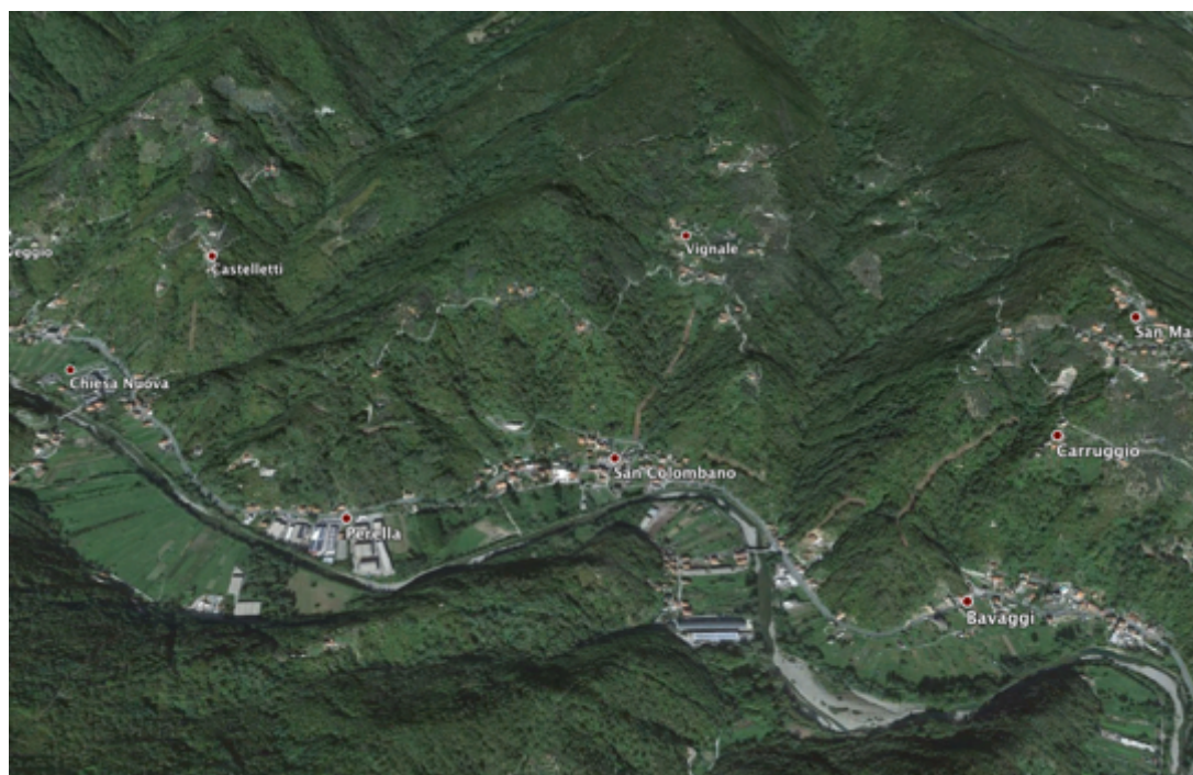
Foto 2 La Val Fontanabuona all'altezza dell'abitato di San Colombano Certenoli – le pendici terrazzate in sponda sinistra del Torrente Lavagna