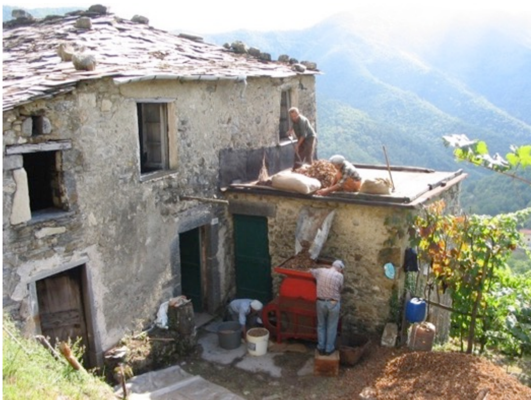
Foto 7 – 8 Casa terrazzo - Fasi della lavorazione per l'eliminazione delle brattee dal frutto della nocciola