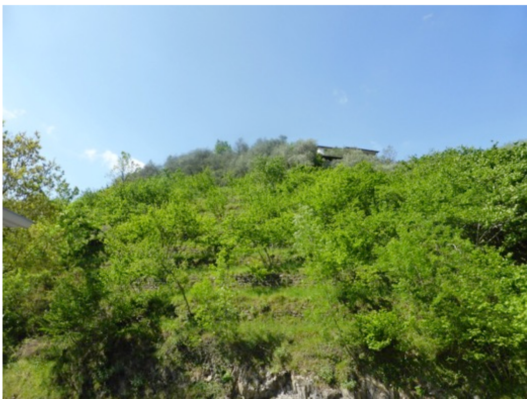
Foto 3 Noccioli in habitus estivo