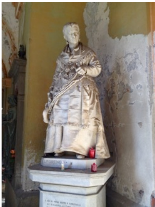
Foto 10 Monumento funebre di Caterina Campodinico "venditrice di noccioline" – Cimitero di Staglieno - Genova