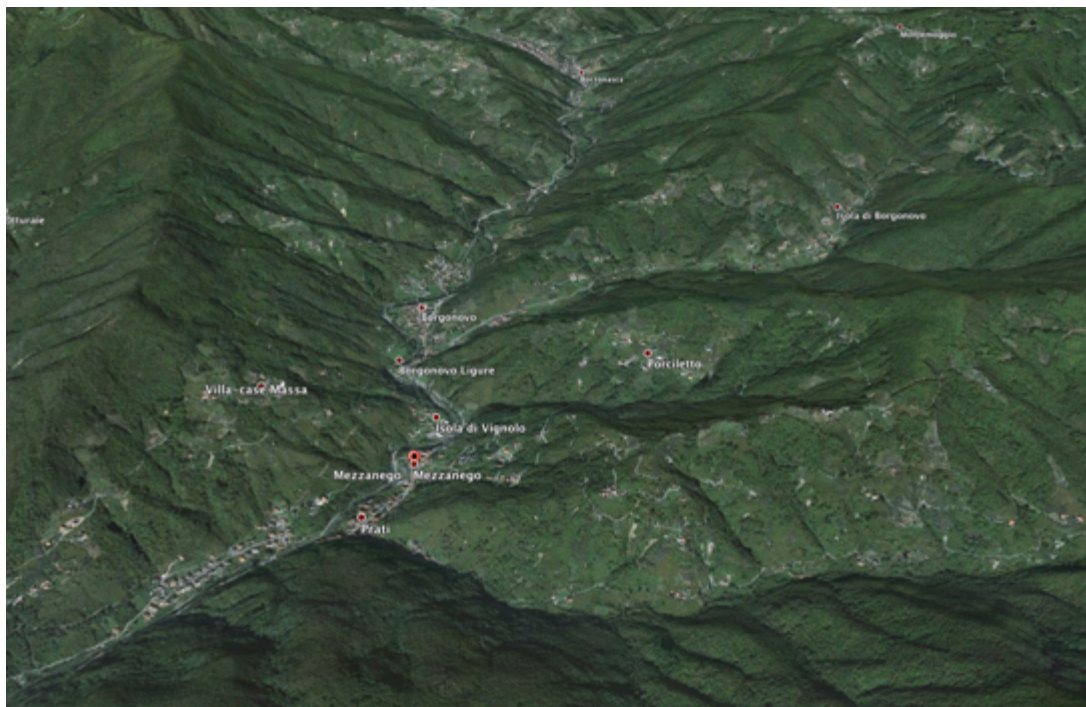
Foto 1 La Valle del Torrente Sturla e dei suoi affluenti di sponda sinistra